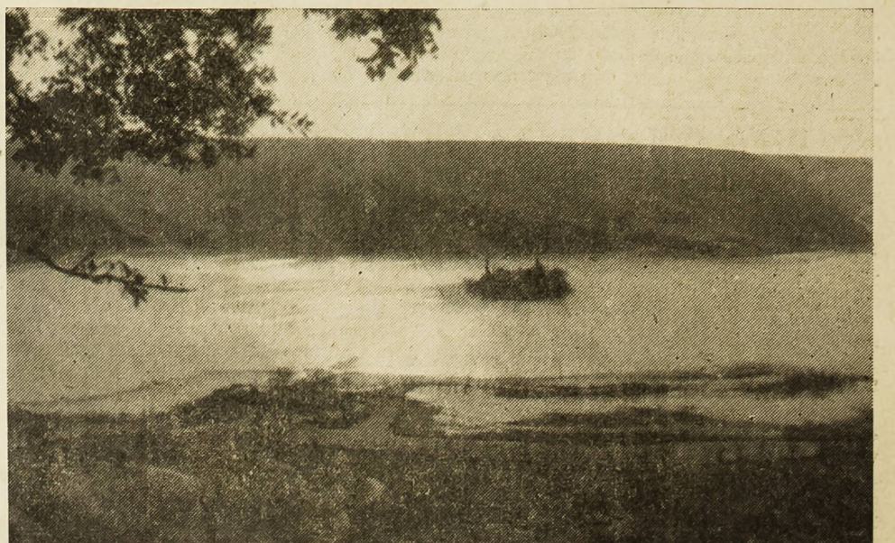
POGLED NA VISOVAC

Stoga pozivamo naše građane da preko »Sibenskog lista« iznesu svoja mišljenja i prijedloge, što će pridonijeti da se zaista pronade najprikladnije položaj za smještaj stalne ljetne pozornice.