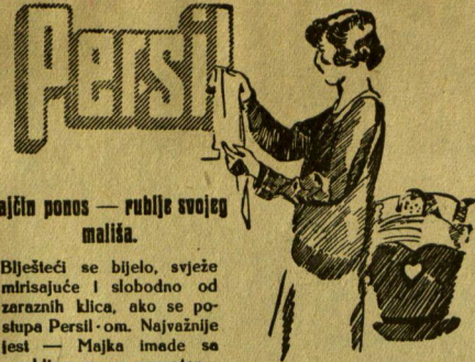
Majčin ponos — rublje svojeg mališa.